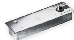
Cobertura de alta qualidade em aço inoxidável